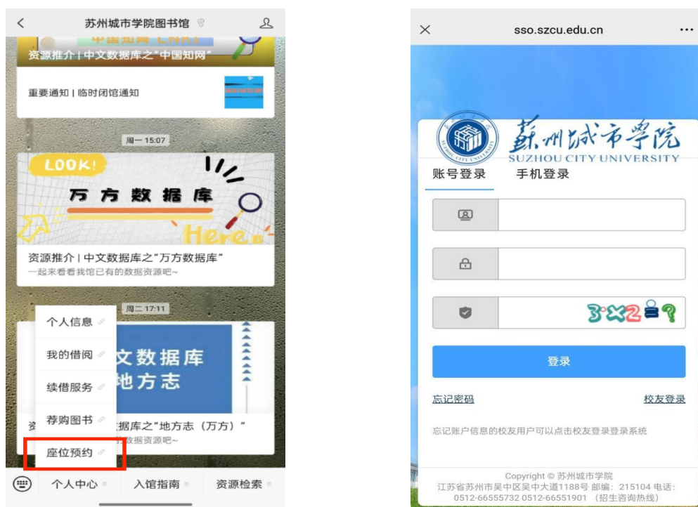
图7 公众号登录流程

在“苏州城市学院图书馆”微信公众号中选择“个人中心”→选择“座位预约”→进行“统一身份认证”（一次认证成功后系统会自动保存读者信息）