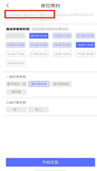
图 9 快速预约