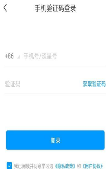
图 5 手机验证码登录

a.打开 APP，选择手机号获取 验证码 的方式 登录 （若未注册，则需按照 APP 指引绑定借阅证号）