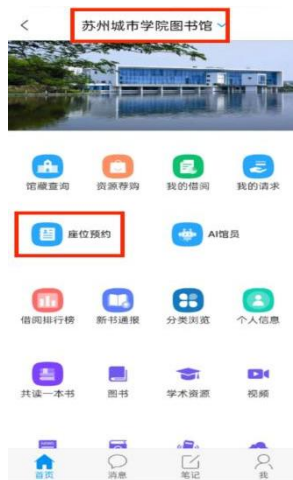
图 2 座位预约页面