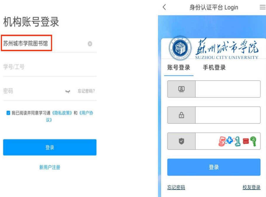
图 6 其他登录方式流程

b.选择 其他登录方式 →机构账号登录中选择“苏州城市学院图书馆”→进行“统一身份认证”（一次认证成功后系统会自动保存读者信息）