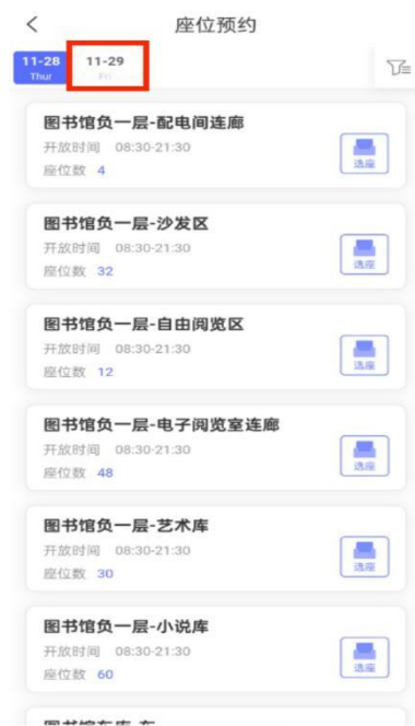
图 10 预约次日座位