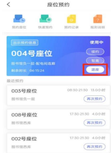
图 12 签退