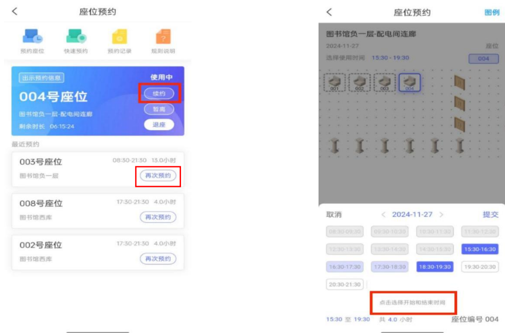
图 14 续约流程图

如预约时间到，该座位尚未被其他人预约,可点击“ 续约 ”。同时，近期预约座位可“ 再次预约 ”。选择续约时间段，提交后完成安全验证，则成功续约。