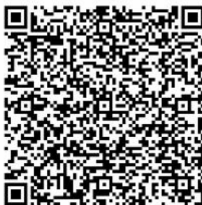
图 1 超星学习通 APP 二维码

①手机端下载安装 超星学习通 APP ，在 APP 首页内选择“苏州城市学院图书馆”，找到“座位预约”功能，选择“预约选座”或“快速预约”。（预约选座为自主选择，快速预约为系统随机分配座位）