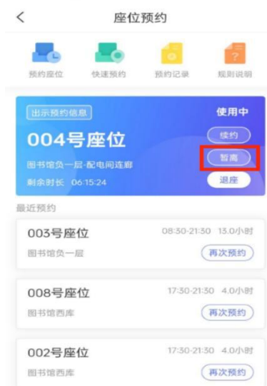
图 13 暂离

一般时段暂离可保留 20 分钟；用餐时段，午餐：11：30~13：00、晚餐：17：30~19：00，暂离保留 90 分钟。过时不回该座位将被释放。